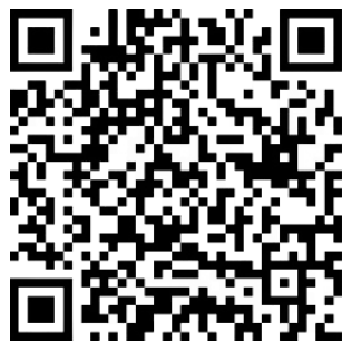
Catholic Welfare Services

为弱势群体捐款 - 请继续在经济上支持天主教福利服务机构，因为我们不分种族或信仰为在我们中的穷人和有需要的人服务。教友们可扫描此二维码以藉全球砂支付捐款给天主教福利机构。在确认交易之前，请确认收款者是 ‘ Catholic Welfare Services ’（天主教福利机构）。教友们也可以在线转帐或现金存款致以下收款者：