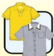
有领或端庄 整齐服饰