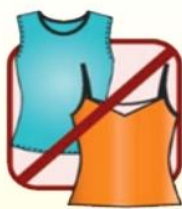
无袖/深V领口及 露肚装