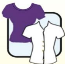
圆领/有领长袖或 短袖衬衫或T恤