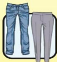
休闲长裤 或西装长裤